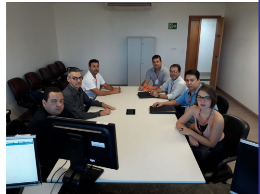
Sindicato patronal e sindicatos laborais, em reunião no ministério do trabalho e emprego de Goiás-GO

Quando o sindicato patronal ofereceram o reajuste sobre o valor da inflação do mês de março no valor 1,55%, a retirada da Participação de Lucros e/ou Resultados (PLR) e outros benefícios. Indagamos se isso seria o que um funcionário merecia, então um diretor do setor patronal disse; «os funcionários tem que decidir entre o aumento ou emprego».